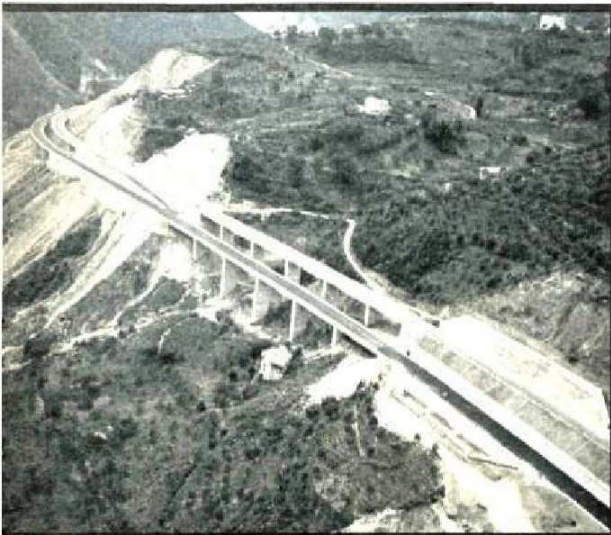
Qui sopra: l'ardito tracciato autostradale nei pressi di Palmi. Sotto: un tratto della A3 presso Cosenza a carreggiate separate e sfalsate.

Sull'altra sponda, in zione delle autostrade Per quanto riguarda la lavori è ad oltre il 60 Fra qualche mese sarà di Taormina. Tutta la corribile entro il 1970. tanto buone per la Cata eco alle parole del min elogio ai tecnici dell'AN geometri e geologi già Salerno-Reggio Calabria ragione numerosi tecni tato i manufatti già co finito la Salerno-Reggio