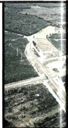
Sotto: il viadotto • Sfalasso lo svincolo di Rosarno. In merose opere ardite.