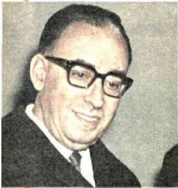
Il ministro dei LL.PP. Mancini

Dalle Alpi allo Stretto è già in funzione un ininterrotto sistema di 1000 km * Fra pochi mesi sarà transitabile il 90 per cento della Salerno - Reggio * Un'opera titanica realizzata dall'ANAS * Una dichiarazione del ministro Mancini