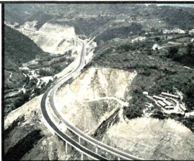
L'autostrada Salerno-Reggio Calabria è stata definita da numerosi tecnici italiani e stranieri un'opera titanica. Il merito è dei tecnici dell'ANAS.